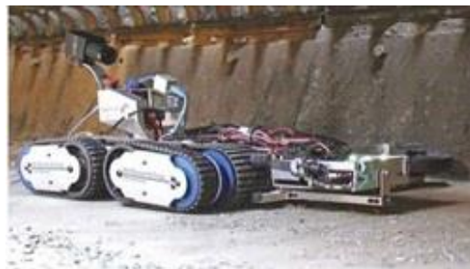
講演で紹介があった狭隘部で活躍するロボット

橋梁などの点検は5年に1回、近接目視により実施されています。この近接目視は機械足場、仮設・固定足場から点検技術者が、打音検査を含む非破壊検査技術などで行っています。